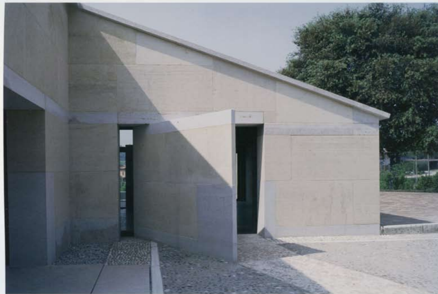
Bricolo Falsarella Associati, Cantina Gorgo, Custoza, Verona 2005, vista d'insieme del nuovo intervento. A pag. 44: la porta pietrificata vista da dentro il portico. A pag. 42: vista di scorcio del portico in pietra montata a secco, basamento, architrave e cornicioni in nembro veronese sp. 60 cm, muro in pietra vicentina blocco tipo 200x100x60 cm. A pag. 43: schizzo della all'ingresso della zona vendita e vista della zona vendita edificata su un lato dell'aia esistente, sullo sfondo la casa padronale.