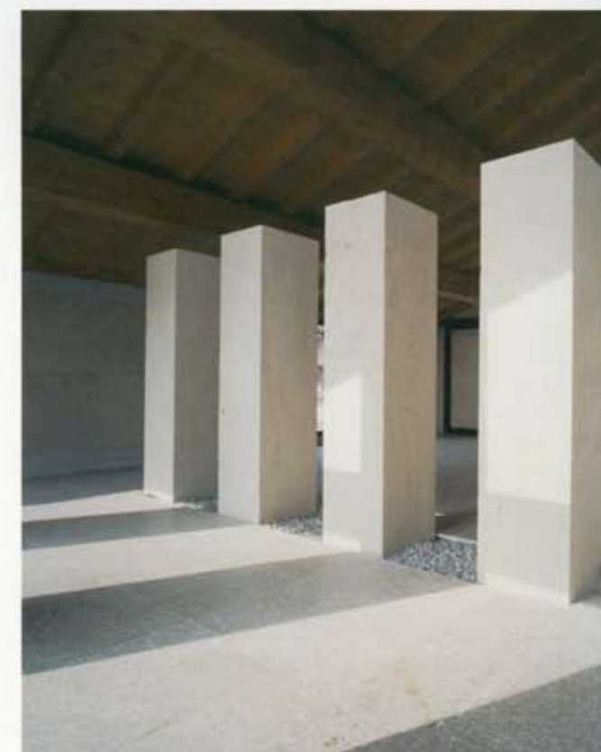
Bricolo Falsarella Associati, Cantina Gorgo, Custoza, Verona 2005, dall'alto: la porta pietrificata all'ingresso della zona vendita, sulla destra l'aia esistente e sullo sfondo il grande Leccio; vista interna del portico, la nuova parete lignea in larice spazzolato contrapposta alla nuova parete in pietra; vista interna della zona vendita con i quattro monoliti 60x60x250 in pietra di Vicenza. A pag. 47: la porta pietrificata all'ingresso della zona vendita.