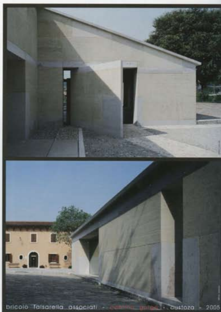
bricolò falsarella associati - cantina gorgo - custoza - 2005