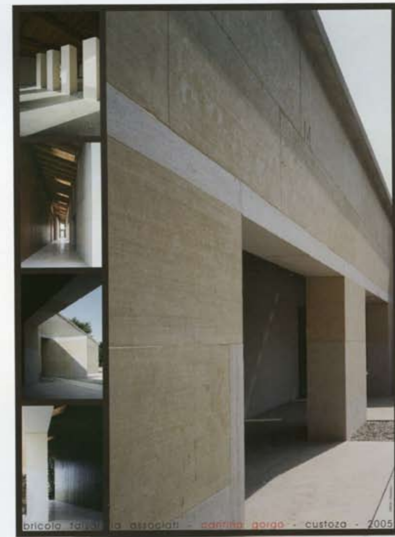
bricolò falsarella associati - cantina gorgo - custoza - 2005